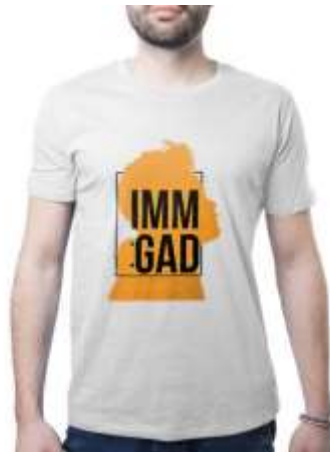
Gambar 13. Kaus