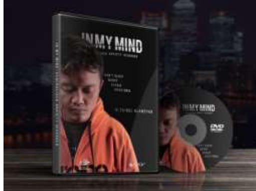
Gambar 11. DVD

Sebagai media pendukung film, DVD menjadi media pendukung dalam pendistribusian film secara offline . Desain sampul dus DVD dan sampul DVD dibuat lebih menarik minat penonton. Berikut desain sampul DVD.