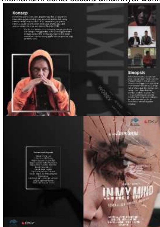
Gambar 12. Brosur

Brosur berfungsi sebagai media promosi dan sebagai informasi pelengkap mengenai isi film ini. Media ini di harapkan dapat menarik minat penonton lebih banyak dan lebih memahami cerita secara umumnya. Berikut visualisasi brosur.