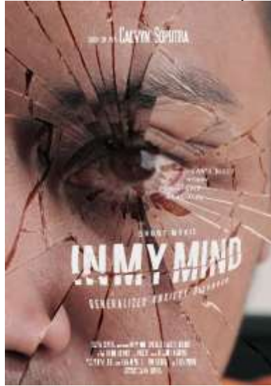
Gambar 8. Poster

sampul dari film ini, dimana penonton melihat poster terlebih dahulu sebelum menentukan pilihan menonton. Berikut visualisasi poster film pendek ini.