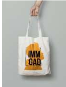
Gambar 16. Tas Jinjing