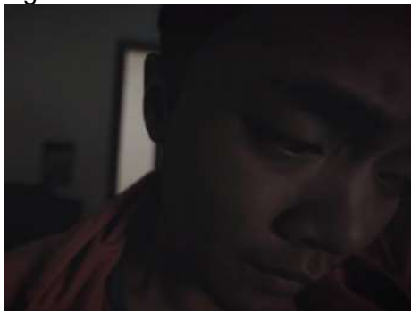
Gambar 4. Scene 9a

Adi merasa cemas dan gagal dengan ujian yang sebelumnya dia kerjakan. Pada adegan ini ekspresi Adi menunjukkan kegelisahannya. Dengan menggunakan teknik P.O.V SnorriCam , ekspresi Adi dapat tertangkap dengan jelas dan lebih berfokus pada apa yang dirasakan oleh Adi.