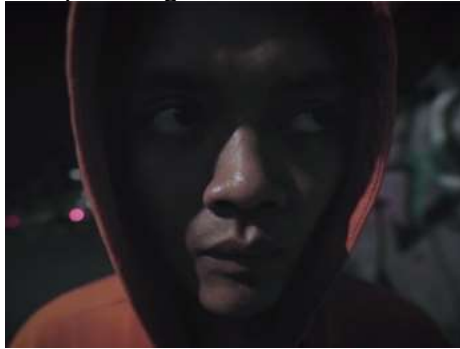
Gambar 3. Scene 6

Adegan Adi merasakan kecemasan dan mencari pelarian dalam scene ini di ambil dalam satu kali pengambilan gambar dengan menggunakan teknik P.O.V SnorriCam . teknik tersebut digunakan untuk menunjukkan ekspresi ketegangan, kecemasan, dan ketakutan Adi selama dia melewati jalan tersebut. Dengan teknik ini penonton dapat melihat ekspresi Adi dari dekat dan teknik ini dapat memberikan efek yang unik terhadap sudut pandang aktor.