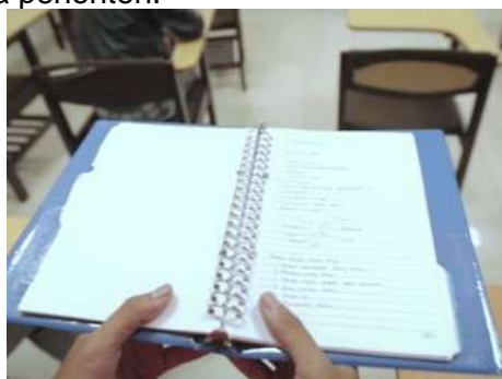
Gambar 2. Scene 2

Adi diceritakan sedang membacakan soal yang diperintahkan kepadanya. Dalam adegan ini ditunjukkan Adi merasakan kegugupan ketika membaca soal tersebut di depan teman-temannya. Adegan ini menggunakan teknik P.O.V sebagai cara penyampaian pesan tersebut (lihat pada gambar 2). Pemilihan teknik P.O.V pada adegan ini bertujuan untuk menunjukkan posisi sebagai Adi kepada penonton. Ketegangan, kecemasan, ketakutan, dan malu yang di rasakan Adi dapat tersampaikan kepada penonton.