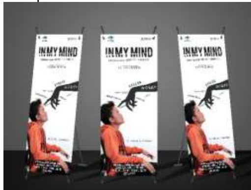
Gambar 9. X-Banner

Salah satu media pendukung film ini adalah x-banner . Media ini berfungsi sebagai media promosi film pendek ini. Media ini dipilih Karena ukurannya yang lebih kecil dari spanduk atau banner pada umumnya, pesan yang disampaikan bisa menjadi lebih kuat hanya dari format minimalis. Konsep visual dalam kemasan minimalis malah sering menciptakan impresi yang kuat bagi orang yang melihatnya. Berikut hasil visualisasi x-banner film pendek ini.