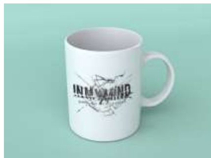
Gambar 15. Mug

Mug memiliki sifat tahan lama dan dapat digunakan dalam promosi jangka panjang tidak seperti brosur atau flyer yang sekali pakai. Berikut adalah visualisasi mug.