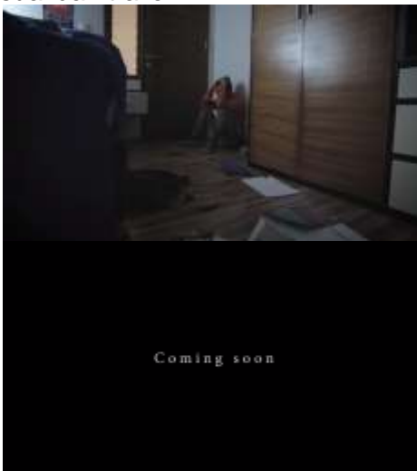
Gambar 7. Trailer

Trailer digunakan sebagai promosi film pendek ini yang ditayangkan melalui video berdurasi 50 detik. Trailer tersebut memuat plot inti film pendek ini. Berikut beberapa tampilan visual dari trailer film ini.