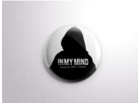
Gambar 17. Pin

Sebagai media yang murah dan dapat diproduksi massal. Pin dapat diberikan kepada target promosi dengan jangkauan lebih banyak dan hemat biaya. Berikut adalah visualisasi pin.