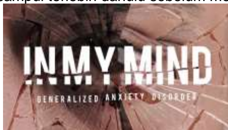
Gambar 10. Thumbnail

Thumbnail digunakan sebagai elemen pelengkap pada film ini. Khususnya pada platform Youtube. Thumbnail berfungsi sebagai sampul pada film ini, dimana orang dapat melihat sampul terlebih dahulu sebelum melihat film ini.