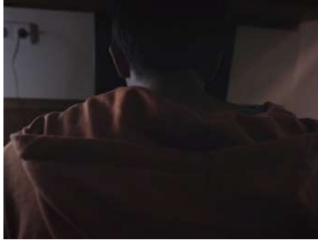
Gambar 5. Scene 9b