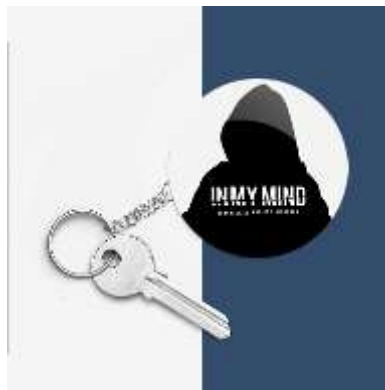
Gambar 14. Gantungan Kunci

Sebagai media yang murah dan dapat diproduksi massal. Gantungan kunci sangat dekat dan berguna bagi semua orang. Hal tersebut dapat dimanfaatkan sebagai pengingat dan recall terhadap film ini. Berikut adalah visualisasi gantungan kunci.