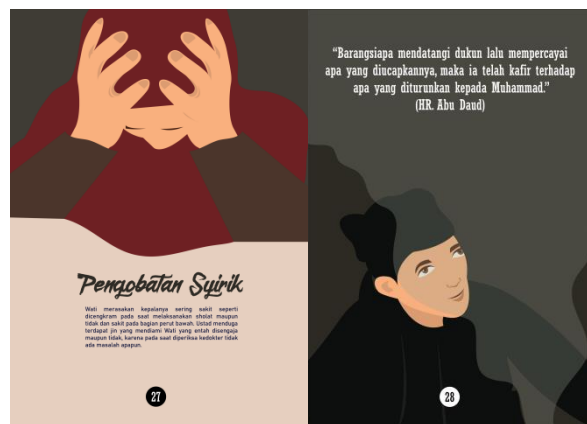
Gambar 8. Implementasi Font

Gambar 8 adalah penerapan font pada desain buku ilustrasi ruqyah, ukuran font 12 pt agar readability jelas dan estetika visualnya bagus.