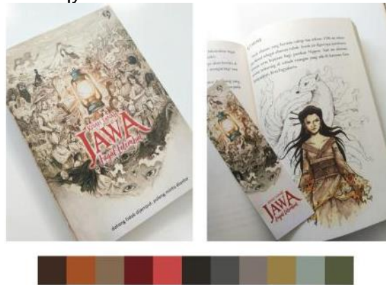
Gambar 10. Palette Warna

Warna dibawah ini diambil dari buku "Kisah Tanah Jawa" yang merupakan salah satu komparator. Warna ini akan digunakan untuk menentukan cerita dalam tahap pertama, yaitu cerita masa lalu pasien ruqyah.