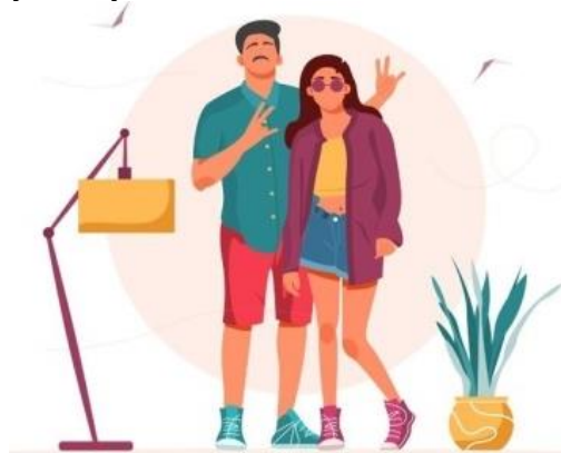
Gambar 1. Contoh Ilustrasi referensi

Pada konsep visual ilustrasi dalam buku ini menggunakan karakter yang terkesan tegas yang menggambarkan orang-orang dewasa yang serius dalam menjalani kehidupan sehari-harinya. Karakter dan bentuk-bentuk lainnya yang ada dalam perancangan ini nantinya akan mengikuti keyword yaitu " Bad Stories for Life Lessons ".