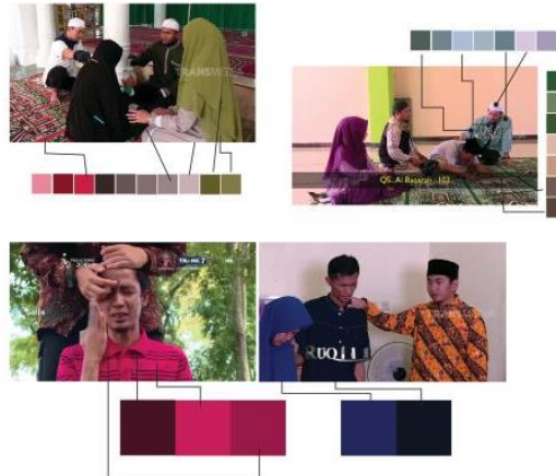
Gambar 9. Palette Warna

Warna dibawah ini diambil dari buku "Kisah Tanah Jawa" yang merupakan salah satu komparator. Warna ini akan digunakan untuk menentukan cerita dalam tahap pertama, yaitu cerita masa lalu pasien ruqyah.