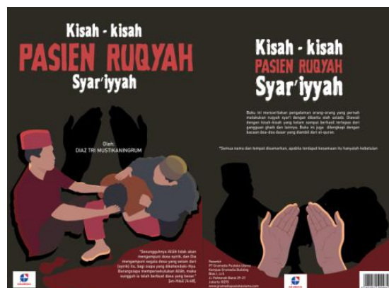
Gambar 11. Implementasi Lay out pada cover buku

Layout yang akan digunakan menggunakan prinsip desain yaitu keseimbangan supaya lebih mudah dibaca dan terdapat gambar disetiap cerita agar pembaca tidak mudah bosan.