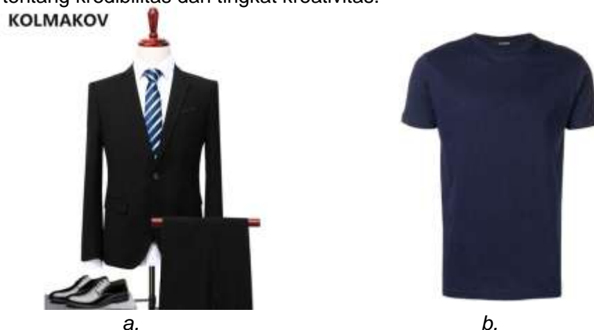
Gambar 1. (a). Setelan busana Jas yang umum digunakan pada saat menjalankan kegiatan bisnis. (b). T-Shirt polos yang umumnya digunakan pada saat melakukan kegiatan non-formal.

Hasil tersebut bertolak belakang dengan hasil penelitian yang dilakukan oleh Bellezza di Massachusetts tentang paduan busana diluar konteks, dimana Bellezza menjelaskan bahwa masyarakat akan mengapresiasi lebih kepada individu yang menampilkan diri mereka secara berbeda dibandingkan kode buda yang telah lazim digunakan oleh masyarakat umum. Namun di Kota Malang, masyarakat masih mengapresiasi individu dengan busana formal sebagai sosok yang memiliki kemampuan, dapat diandalkan dan kreatif. Sebaliknya individu yang mengenakan busana nonformal seperti kaos mendapatkan penilaian yang cukup rendah jika dikaitkan tentang kredibilitas dan tingkat kreativitas.