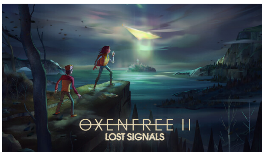
Gambar 2. Game Oxenfree