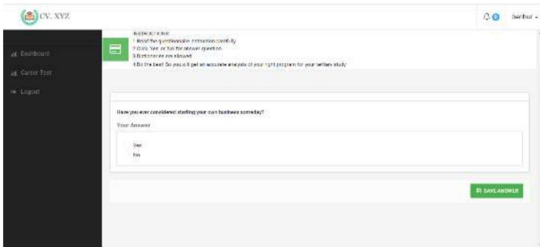
Gambar 4 Halaman Career Test

Pada saat login terdapat menu data diri siswa. Pada menu data diri siswa, terdapat sebuah form yang berisi identitas yang harus diisi oleh siswa meliputi Foto, Nama, E-mail, No Telepon, Alamat, Provinsi, Kota, Tempat lahir, Tanggal lahir, nomor passport, Nama orangtua, nomor telepon orang tua serta alamat E-mail orang tua siswa.